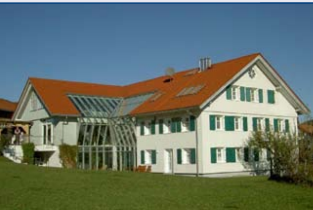
Exklusives Berghofgut in traumhafter Landschaft bei Füssen, € 3,00 Mio.