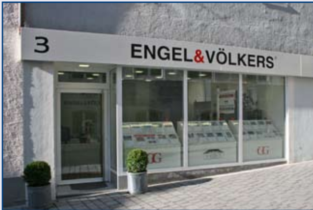
Klostersteige 3, Kempten